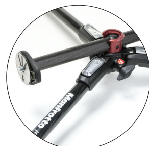
Neuer Q90° Umschlagmechanismus