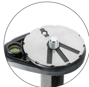
Neue Platte im hochwertigem Design