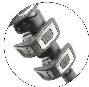
Neues Quick Power Lock System